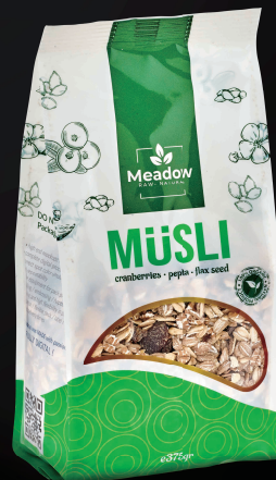
LEC2-330: 适用于制作包装打样、高端标签制作和小批量生产