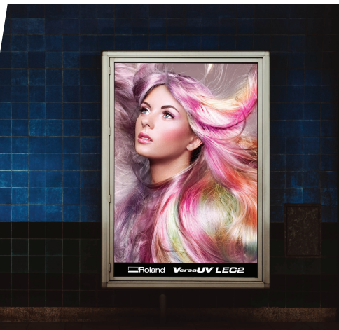
LEC2-640: 适用于制作玻璃橱窗、高端的背光灯箱和墙体海报